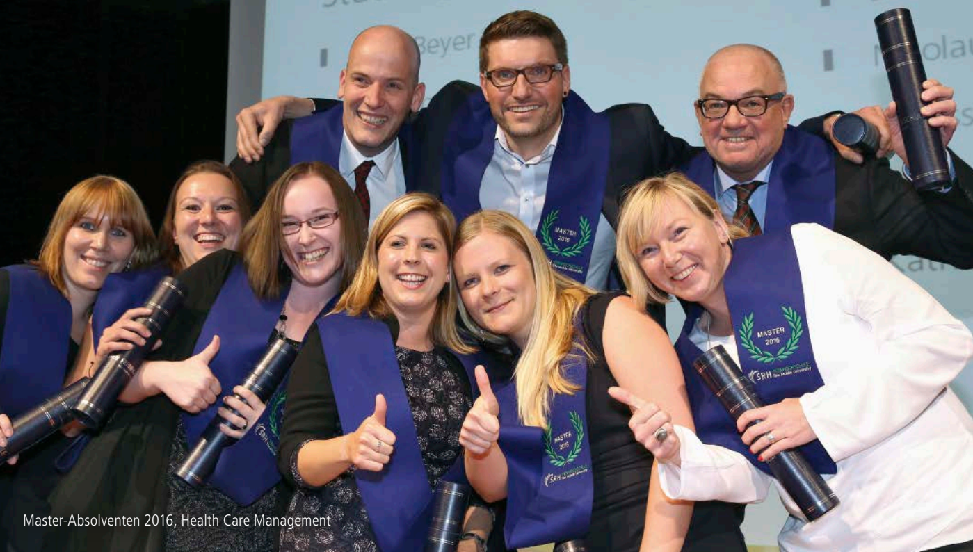
Master-Absolventen 2016, Health Care Management